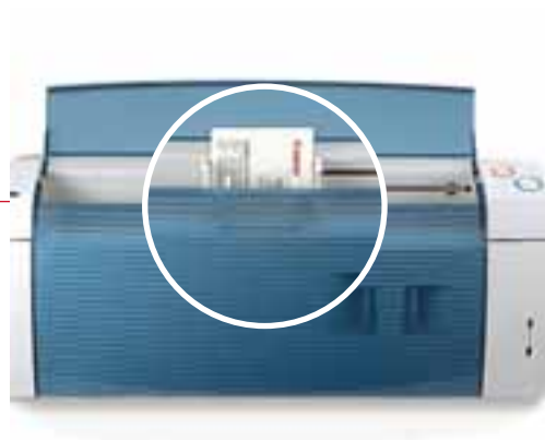
Vignettes / Multi-fenêtrage