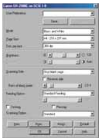
Facile à paramétrer

Pré-numérisation – pour obtenir la meilleure qualité d'image possible pour un lot, en adaptant le contraste et la luminosité sur la première page numérisée. Affichage dynamique des réglages à l'écran.