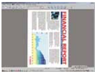
Image plein écran

Le logiciel de reconnaissance de caractères OmniPage™ (OCR) complète cette offre logicielle en étendant encore le champs d'application du DR-2050C.